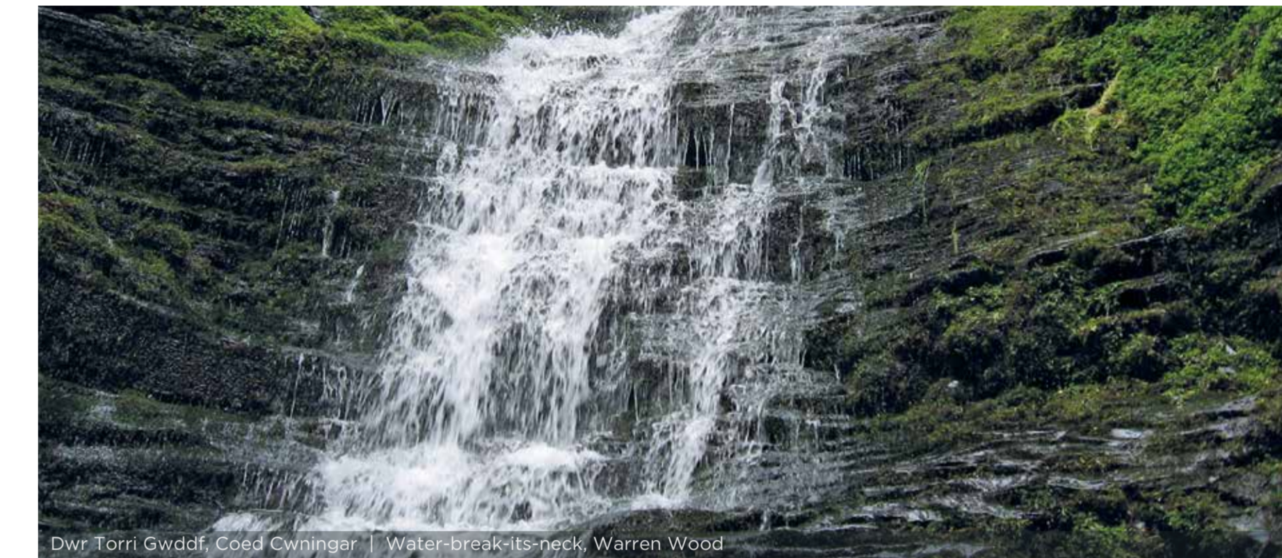
Dŵr Torri Gwddf, Coed Cwningar | Water-break-its-neck, Warren Wood