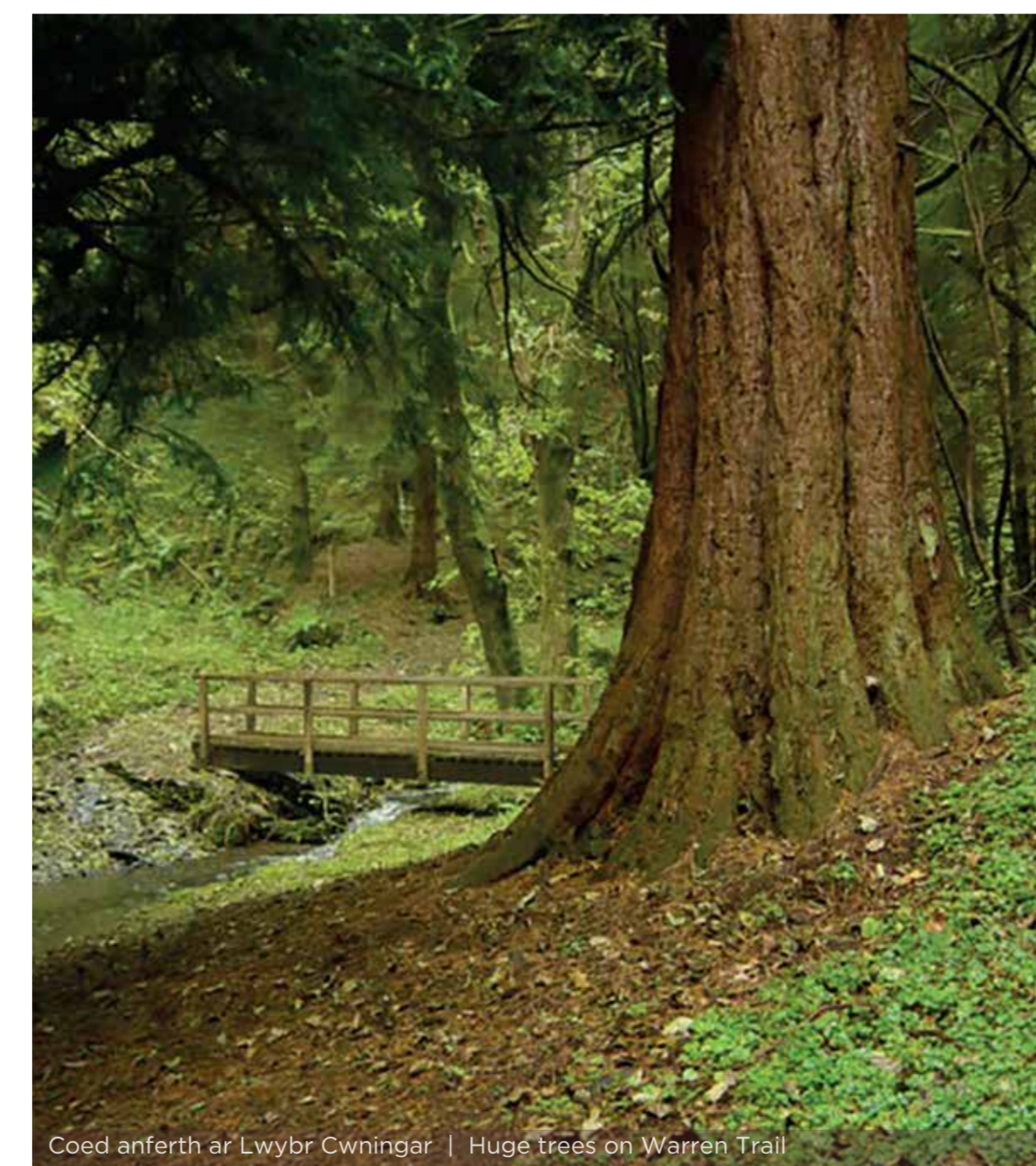
Coed anferth ar Lwybr Cwningar | Huge trees on Warren Trail