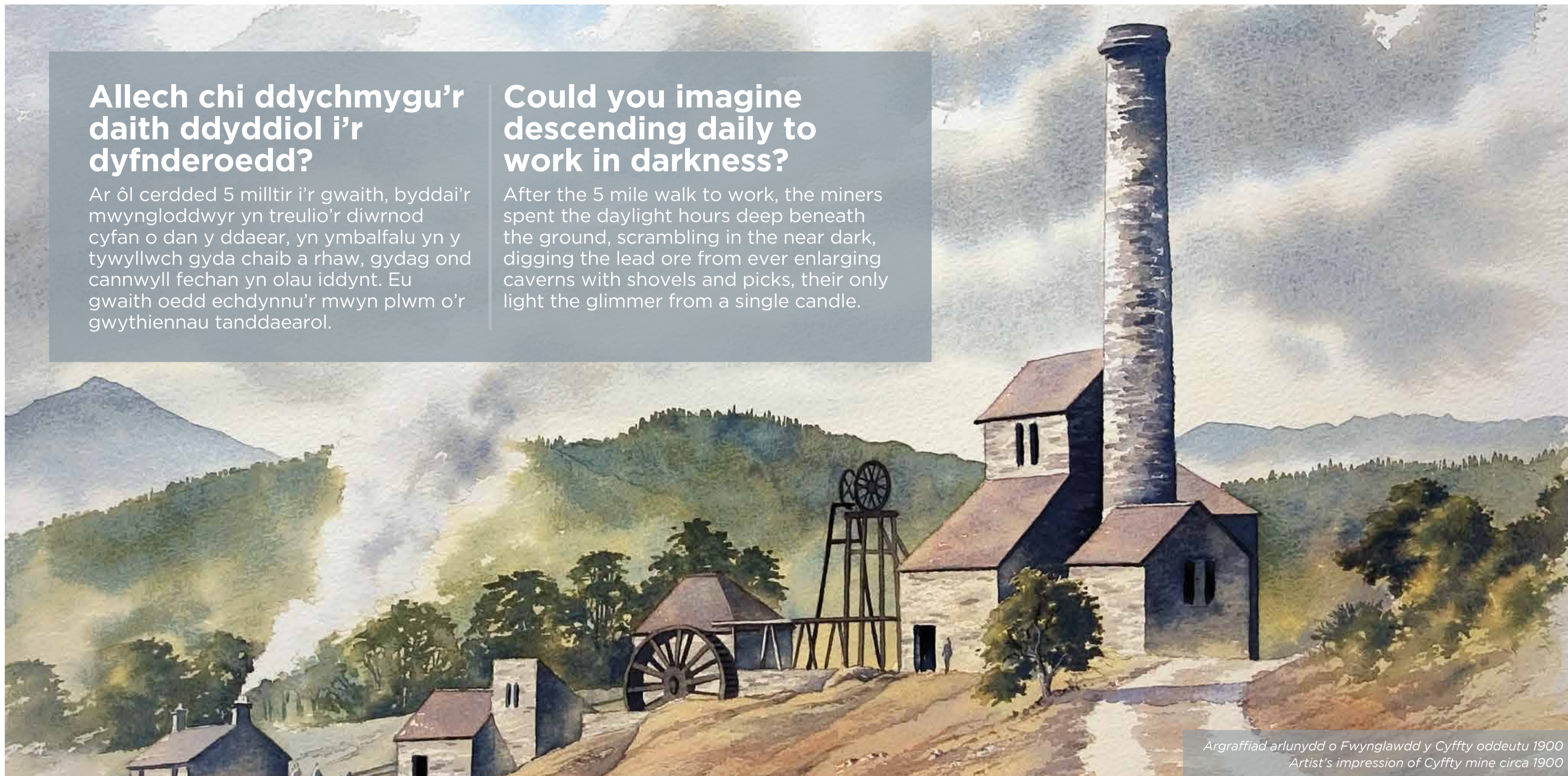
Argraffiad arlunydd o Fwynglawdd y Cyffty oddeutu 1900 Artist's impression of Cyffty mine circa 1900

After the 5 mile walk to work, the miners spent the daylight hours deep beneath the ground, scrambling in the near dark, digging the lead ore from ever enlarging caverns with shovels and picks, their only light the glimmer from a single candle.