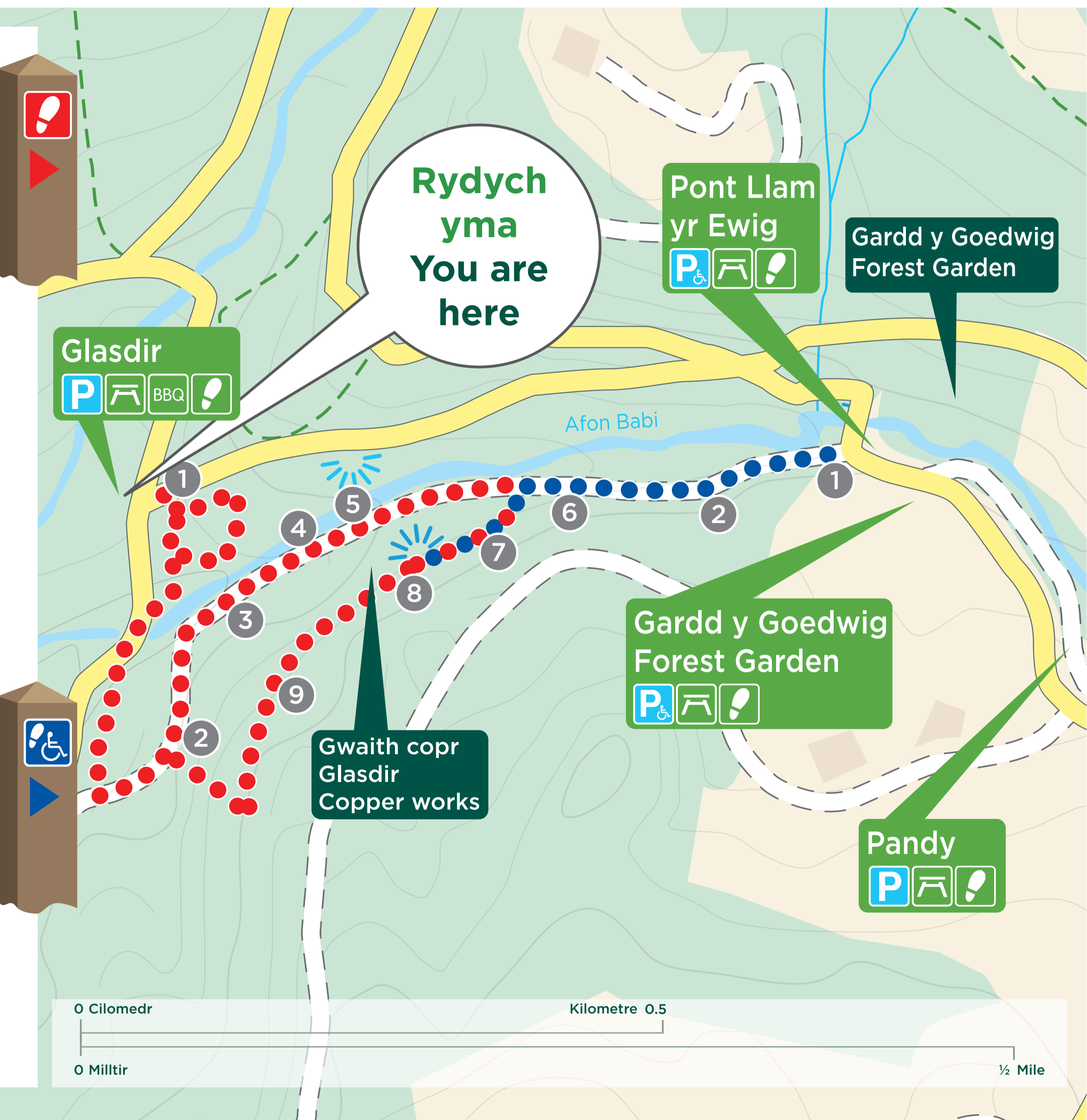
This map is based upon Ordnance Survey material with the permission of Ordnance Survey on behalf of the controller of Her Majesty's Stationary Office 2015

Cadwch at y llwybr hwn gan fod mwyngloddiau yn beryglus ac mae sawl dibyn yma. Please keep to the trail as mine workings are dangerous places with sheer drops.