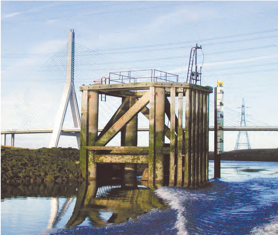
Ffigur 8 Adeiledd ar ochr ddeheuol yr afon, gyferbyn â Glanfa Tata, gyda mesurydd drafft aer yn union i lawr yr afon a Phont Lefel Uchel yr A548 yn y cefndir.

Mae banc helaeth a serth o dywod a llaid ar ochr ogleddol yr afon y tu ôl ac yn union i fyny'r afon o'r Grwyn Dwyreiniol. Rhaid i bob llestr ddilyn y tro yn yr afon o amgylch y banc hwn gan gadw tua'r môr o'r glwydo sydd wedi'i goleuo sy'n marcio diwedd y Grwyn Dwyreiniol.