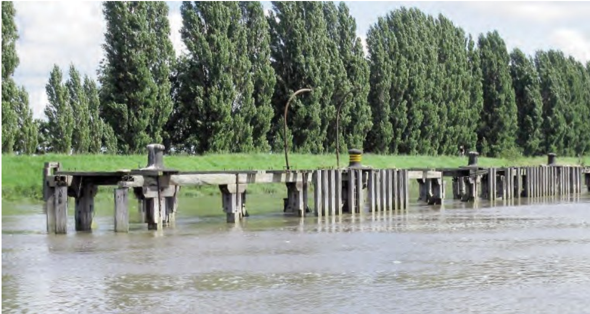
Ffigur 11 Glanfa segur ar lan ogleddol yr afon ac i fyny'r afon o Bont Reilffordd Penarlâg

Mae golau mordwyo ar ochr prif rychwant y bont sy'n wynebu i lawr yr afon yn nodi'r 'Pwynt Tramwy Gorau' – sef tua chanol yr afon – ac yn arddangos golau gwyn sy'n fflachio, sef llythyren Morse "A". Mae triongl coch a gwyn adlewyrchol wedi'i osod yn lle golau ar yr ochr o'r bont sy'n wynebu i fyny'r afon. Mae estyll pren isel yn ymestyn ar hyd llinell glan ddeheuol yr afon ac yn agos iddi yng nghyffiniau Pont Reilffordd Penarlâg. Mae'r llanw'n gorchuddio'r caedau ac wedi'i farcio, ar ei ddau ben, i lawr yr afon ac i fyny'r afon o'r bont, gan glwyd ar bolyn gyda marc brig gwyrdd ar ei ben.