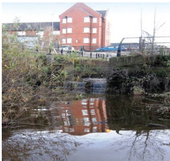
Ffigur 15 Y llifddorau wrth y fynedfa i Gamlas Shropshire Union.

Mae'r llifddorau wrth y fynedfa i fasn Camlas y Shropshire Union wedi'u lleoli yn union i lawr yr afon o Lanfa Crane ar lan ogleddol yr afon. Mae'r llifddorau hyn yn diffinio'r terfyn rhwng yr afon lanwol a dŵr croyw y gamlas. Dylai pobl sy'n gyfrifol am lestrau ac yn bwriadu ymuno neu ymadael â'r gamlas drwy'r llifddorau hyn sicrhau eu bod wedi cael yr holl wybodaeth angenrheidiol yn gyntaf, yn enwedig mewn perthynas â chyfyngiadau hyd, lled a drafft, cyfyngiadau llanw a chyngor ar lywio'r afon a'r aber yn ddiogel (gweler tudalen 31 – Gwybodaeth gyswllt).