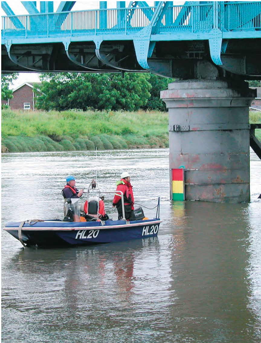
Ffigur 3 Ffotograff o gwch diogelwch yn mynychu gwaith yn yr harbwr ger Pont Las Queensferry.

O bryd i'w gilydd, gwneir gwaith harbwr yng Ngwarchodaeth Dyfrdwy. Gall y gwaith hwn gynnwys adeiladu mannau angori newydd neu atgyweirio a chynnal a chadw adeileddau presennol megis pontydd dros yr afon. Gall gwaith yn yr harbwr gynnwys gweithgareddau deifio masnachol neu olygu bod pobl yn gweithio ar uchder ar adeiledd sydd union uwchben yr afon. Mewn amgylchiadau o'r fath, darperir cychod fel arfer ac maent yn angenrheidiol er mwyn sicrhau bod yr ardal waith yn cael ei chadw'n glir rhag defnyddwyr eraill yr afon. Mae'n ofynnol i bob defnyddiwr fynd yn ei flaen yn ofalus iawn wrth fordwyo o fewn yr ardal waith yn yr harbwr a dilyn y cyngor a roddir gan staff cychod diogelwch.