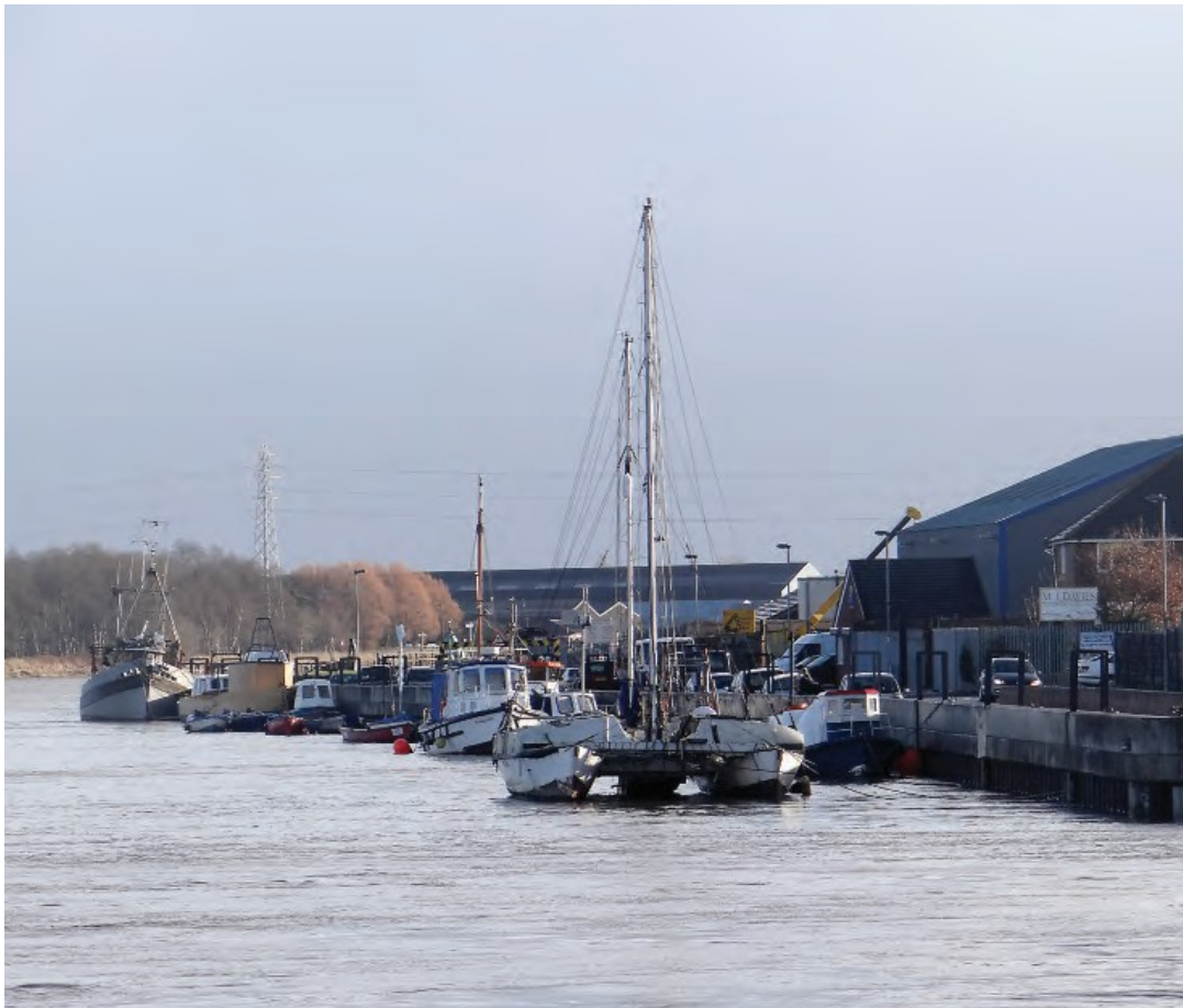
Ffigur 9 Cychod bach wrth ymyl Cei Connah ar y penllanw

sydd wedi'i hangori wrth ymyl, yn enwedig pan geir gwyntoedd cryf o'r gogledd orllewin a all greu amodau sy'n beryglus i gychod bach pan fyddant yn chwythu yn erbyn llanw trai.