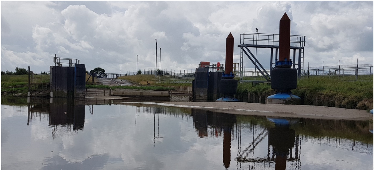
Ffigur 13 Cyfleuster dadlwytho segur Airbus ym Mrychdyn