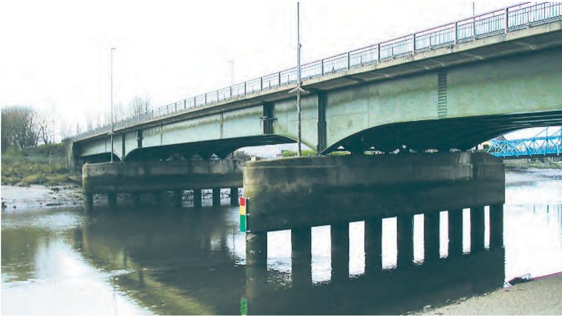
Ffigur 12 Golygfa o bont ffordd yr A494 ar lanw isel o gyfeiriad man i fyny'r afon. Mae bwrdd llanw lliw i'w weld ar bier y gogledd.

Mae pont ffordd yr A494 yn croesi'r afon tua 170 metr (558 troedfedd) i fyny'r afon o Bont Las Queensferry. Mae pont yr A494 wedi'i gosod yn ei lle ac odani ceir y lle clir fertigol lleiaf ar gyfer llestrau – tua 3.8 metr (12.5 troedfedd) – ar benllanw gorllanw. Mae dau ben y pier concrit ar ochr ogleddol y bont hon, sy'n wynebu i fyny ac i lawr yr afon, wedi'u marcio gan olau mordwyo coch sy'n fflachio, sy'n arddangos Ffl.C.5e.