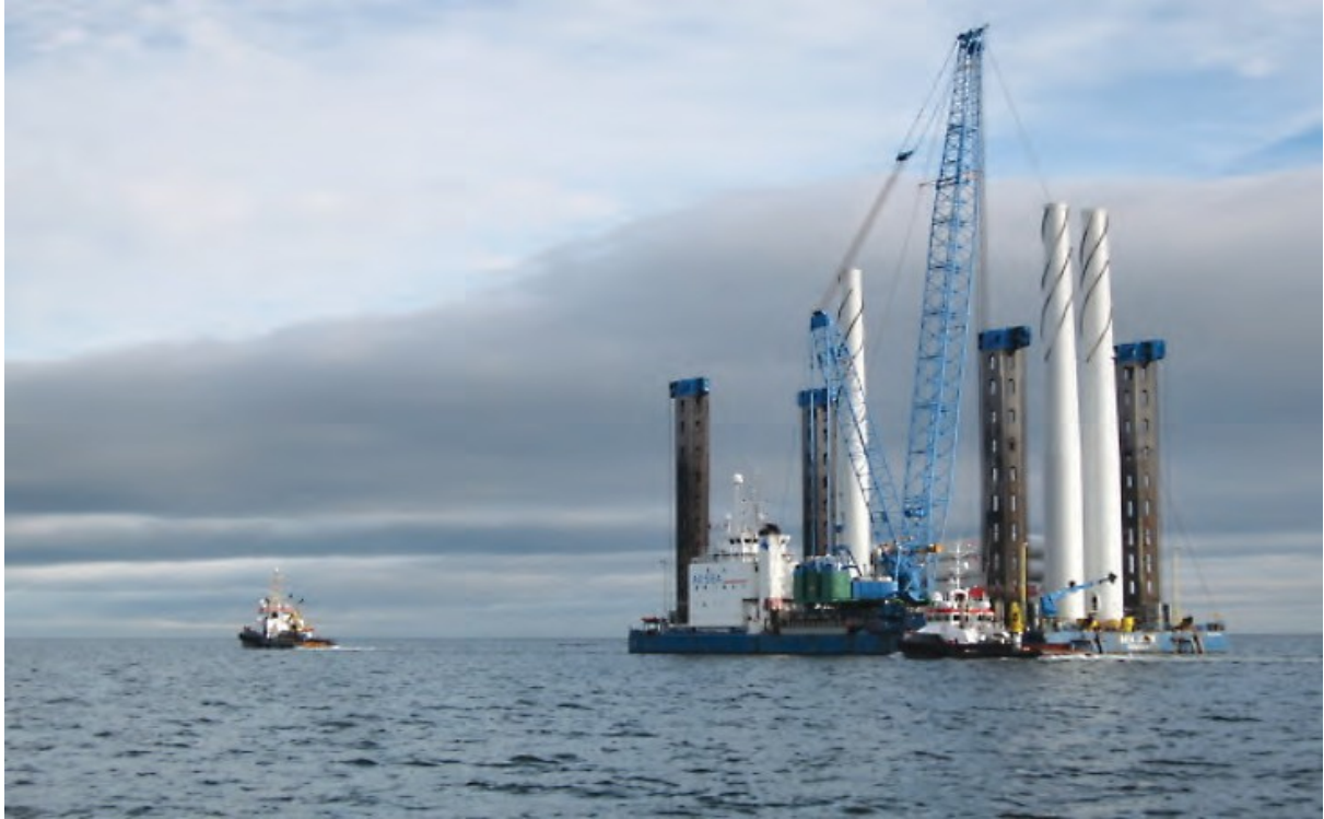
Ffigur 4 Rig fferm wynt o borthladd Mostyn ar ei ffordd allan i'r môr drwy Ardal Weithredol Mostyn.

Mae rhybuddion mordwyo hefyd yn cael eu cyhoeddi gan Mostyn Docks Ltd. i ddarparu gwybodaeth a allai effeithio ar ddiogelwch unrhyw lestr sy'n mordwyo neu'n bwriadu mordwyo o fewn ardal eu hawdurdodaeth neu gyfrifoldeb. Mae'n bosibl i rybuddion mordwyo gael eu darlledu gan Mostyn Docks Ltd. ar sianel VHF 14, neu drwy orsaf leol Gwylwyr y Glannau. Lle bo angen, bydd rhybudd mordwyo'n cael ei ddilyn gan hysbysiad lleol i forwyr gan Borthladd Mostyn. Cyhoeddir yr hysbysiadau hyn gan Harbwrfeistr Porthladd Mostyn ac maent hefyd ar gael ar wefan Porthladd Mostyn.