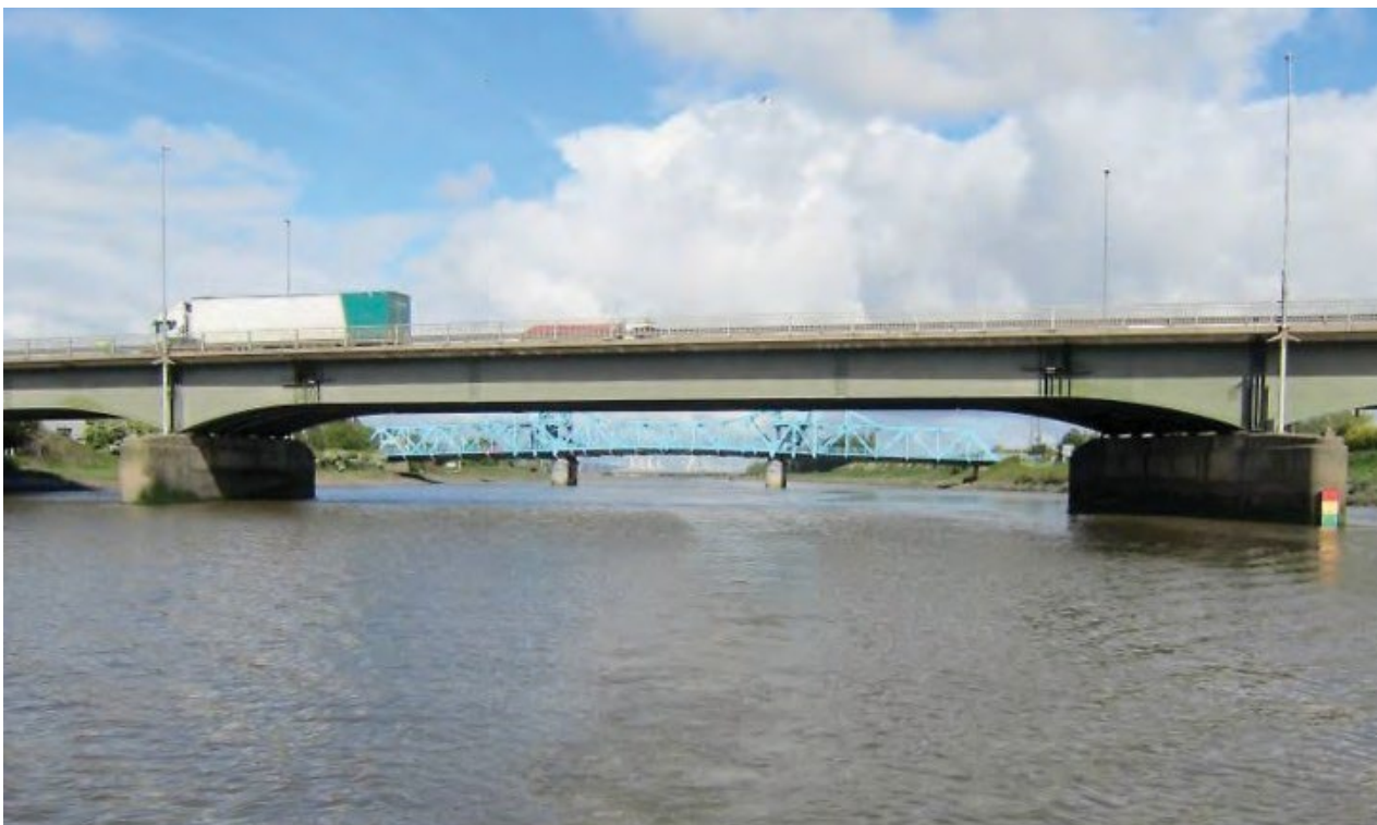
Ffigur 10 Golygfa o bont ffordd yr A494 yn edrych i lawr yr afon tuag at Bont Las Queensferry.

Mae Pont Reilffordd Penarlâg yn croesi'r afon tuag 1.85 cilometr (1.15 milltir) uwchlaw Cei Connah, ac mae prif rychwant y bont, a oedd arfer agor er mwyn i lestrau fynd heibio, bellach wedi'i osod yn ei le. Mae digon o le clir fertigol i lestrau fynd odani – tua 4.5 metr (14.7 troedfedd) – ar benllanw gorllanw.