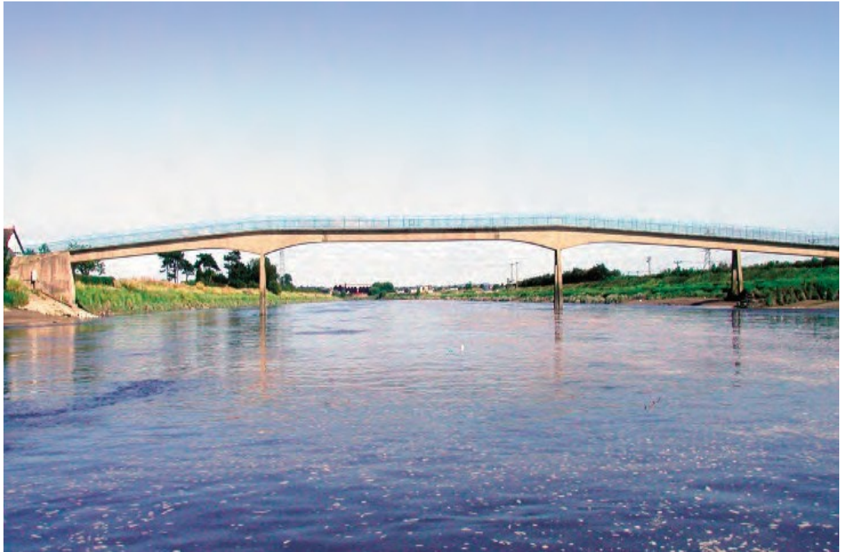
Ffigur 14 Golygfa o bont droed Saltney Ferry Uchaf o fan i lawr yr afon.