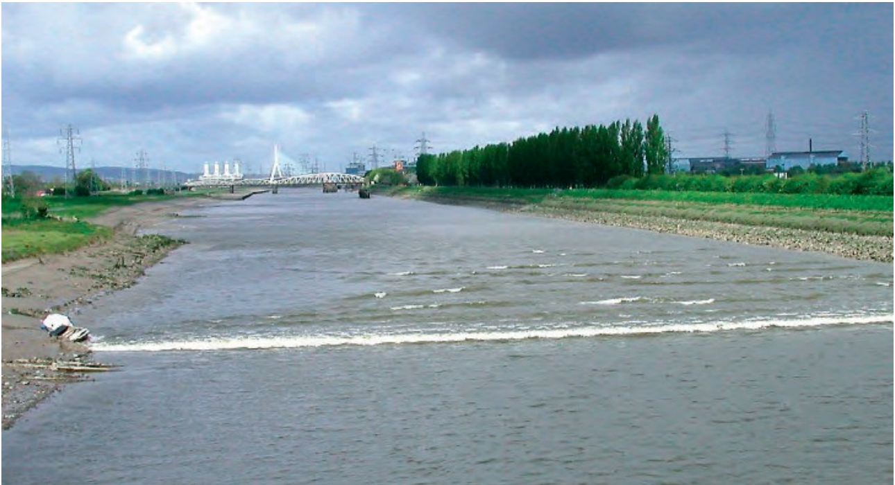
Ffigur 2 Yr eger yn y rhan o'r afon sydd wedi'i chamlesu tua chyfeiriad Queensferry ar ddechrau mewnllif y gorllanw

Felly, mae trefn y llanw yn y rhan o'r afon sydd wedi'i chamlesu yn wahanol iawn i'r aber allanol, lle mae mewnllif y yn para tua 5.5 awr a'r all-lif (traï) yn para tua 6.5 awr.