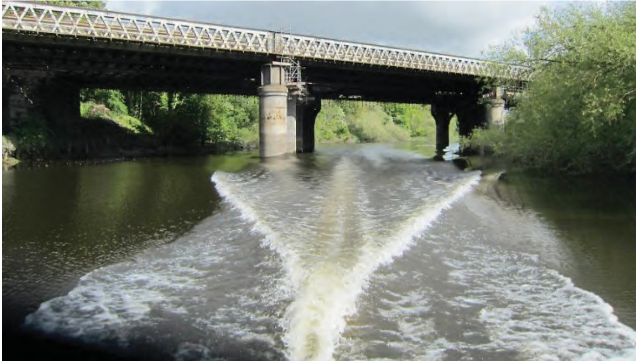
Ffigur 17 Y bont reilffordd yn Wilcox Point, sy'n nodi terfyn Gwarchodaeth Dyfrdwy i fyny'r afon.

Uwchlaw Wilcox Point, Cyngor Gorllewin Swydd Gaer a Chaer yw'r Awdurdod Mordwyo ar gyfer Afon Dyfrdwy. Dylai pobl sy'n gyfrifol am lestrau ac yn bwriadu mordwyo ar hyd afon Dyfrdwy i fyny'r afon o Wilcox Point sicrhau eu bod yn gwbl ymwybodol o ofynion yr Is-ddeddfau perthnasol a wnaed gan Gyngor Gorllewin Swydd Gaer a Chaer (gweler tudalen 31 – Gwybodaeth gyswllt).