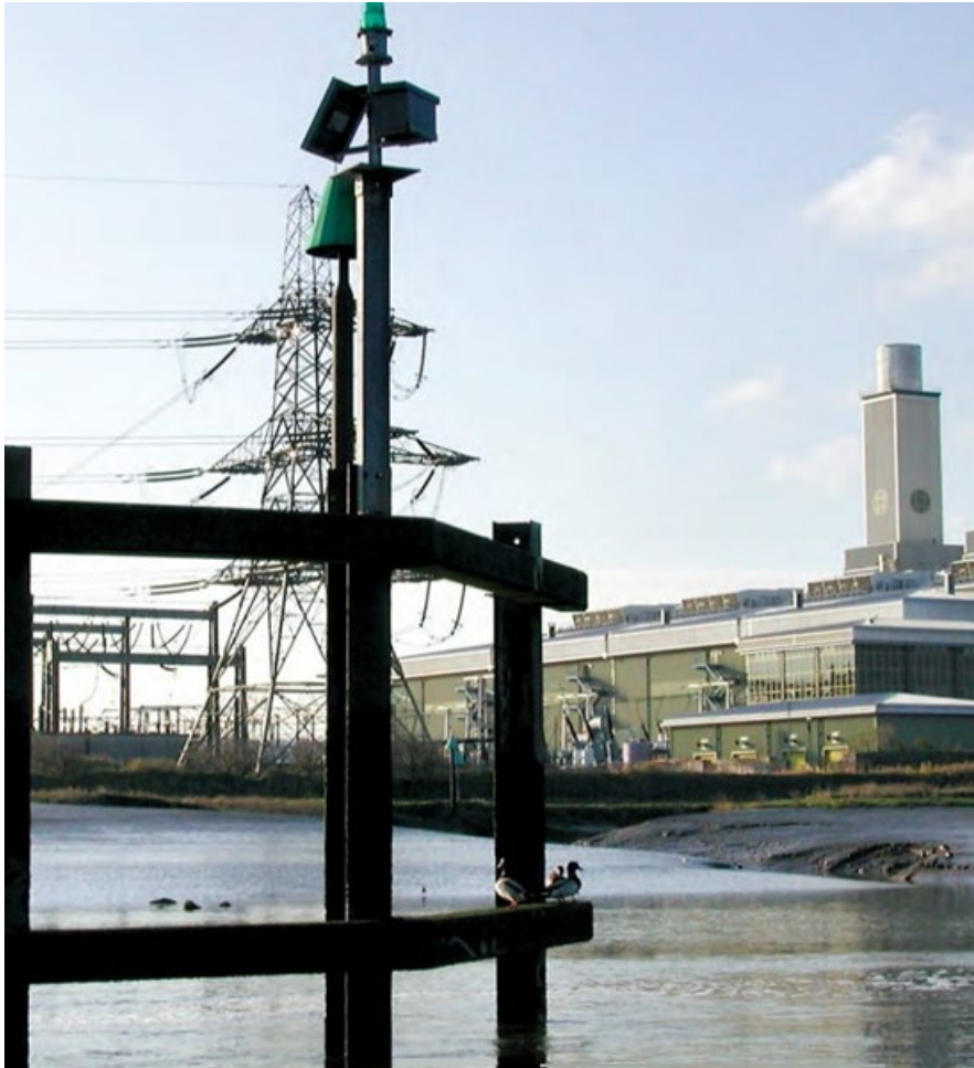
Ffigur 6 Adeiledd y golau ar Wal Hyfforddi'r De.

Yn ei hanfod, mae Wal Hyfforddi'r De yn ffurfio glan ddeheuol yr afon fordwyadwy ac yn estyn o islaw Cei Connah tua'r môr am tua 1.2 cilometr (0.7 milltir). Mae wedi'i farcio ar ei hyd gan 9 clwyd ar bolion, y mae gan bob un ohonynt farc brig gwyrdd (ochr starbord) ar ei phen. Ger y pen o Wal Hyfforddi'r De sydd tua'r môr, sef lleoliad mewnlif / gollyngfa'r orsaf bŵer nwy yn Kelsterton, mae adeiledd sy'n taflu golau mordwyo gwyrdd sy'n fflachio, Ffl.G.5e, y ac yn arddangos dyddnod conigol gwyrdd.