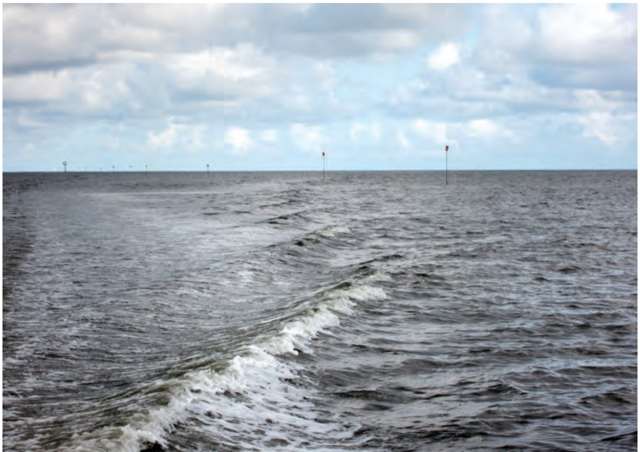
Ffigur 6 Y twr golau ar Wal Hyfforddi'r Gogledd a seilbyst yn edrych tua'r môr dros wal danddwr.

Ar y pen o Wal Hyfforddi'r Gogledd sydd tua'r môr, mae saif twr sy'n taflu golau mordwyo coch sy'n fflachio, Ffl.C.2e. Mae'r pen i fyny'r afon lle mae Wal Hyfforddi'r Gogledd yn cwrdd â'r arglawdd uwch sydd wedi'i orchuddio â glaswellt wedi'i farcio gan glwyd sy'n arddangos golau mordwyo coch sy'n fflachio, Ffl.C.5e., a dyddnod coch (yr ochr port). Ar hyd gweddill ei hyd mae wedi'i farcio gan 10 clwyd ar bolion, y mae gan bob un ohonynt farc brig coch ar ei phen. Ar ochr Cymru'r sianel, rhwng pont ffordd Sir y Fflint a Phwynt y Fflint, mae llongddrylliad suddedig wedi'i farcio gan fwi perygl ynysig sydd wedi'i oleuo, Ffl.2e.