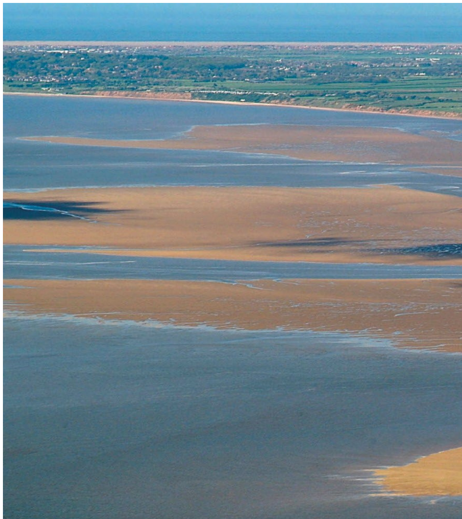
Ffigur 1 Sianeli'r aber rhwng banciau tywod helaeth